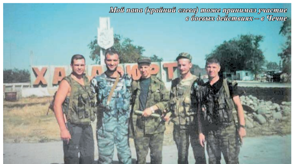
Мой папа (крайний слева) тоже принимал участие в боевых действиях – в Чечне