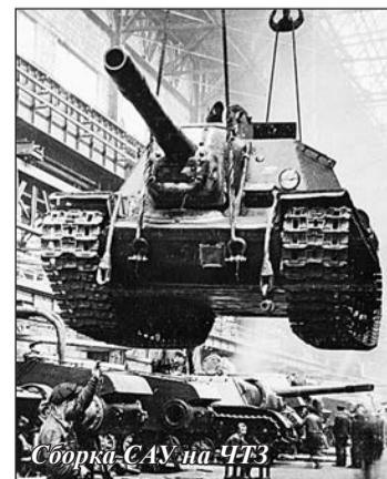
Сборка САУ на ЧТЗ

Как отметил К.Н. Крикунов, подобные выставки в вузе, в том числе на ФВО, проходят регулярно. Они – неотъемлемая часть важнейшей работы по гражданско-патриотическому воспитанию молодого поколения.