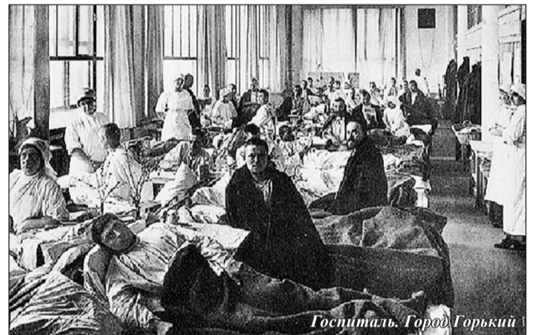
Госпиталь. Город Горький