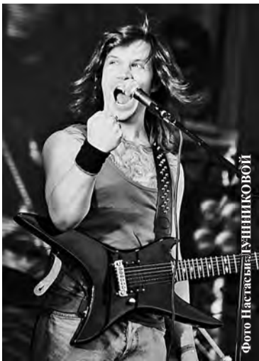
Фото Анастасия КУЗНИКОВОЙ