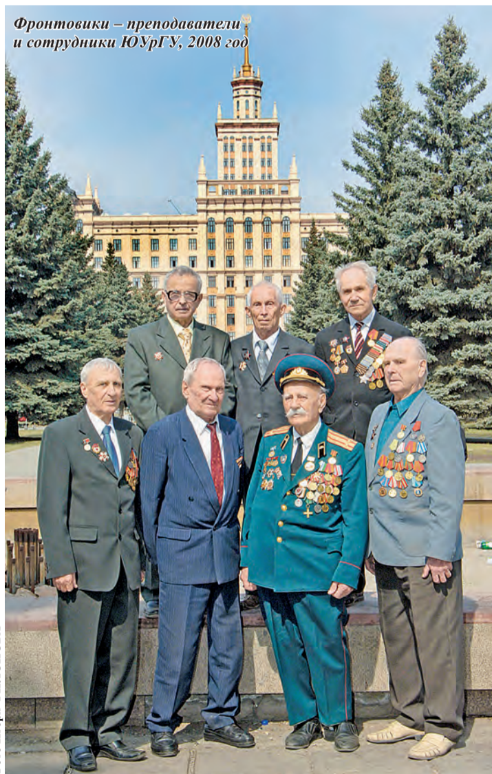
Фронтвики — преподаватели и сотрудники ЮУрГУ, 2008 год