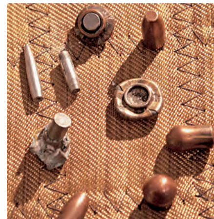
Пули, остановленные тканью бронезилета