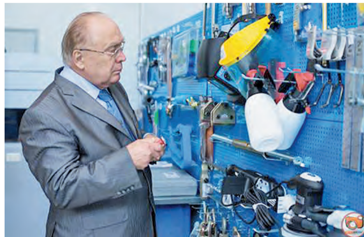
Ректор МГУ Виктор Садовничий в учебном центре новой кафедры

Одновременно набирали абитуриентов. И уже минувшим летом состоялся первый набор – на бюджетные места приняли двадцать пять человек. С первого сентября в учебном центре официально начались занятия. Мы разработали, скажем так, несколько траекторий обучения студентов. В том числе будем готовить специалистов по кузовному ремонту. Кстати, часть наших первокурсников уже прошла обучение по программе подготовки колористов, тренер специально приезжал из Москвы, ребята сдали контрольные тесты, сейчас ждём, когда им вышлют соответствующие сертификаты.