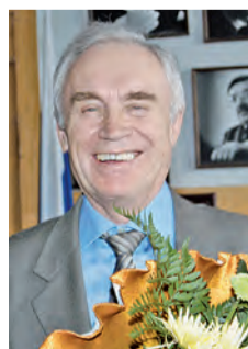
Герман ВЯТКИН, президент ЮУрГУ, член-корреспондент РАН, Почётный гражданин Челябинска и Челябинской области

Желаю «ЮУрГУ-ТВ» новых свершений, интересных тем и героев программ, благополучия и стабильности! Продолжайте удивлять зрительскую аудиторию увлекательными проектами!