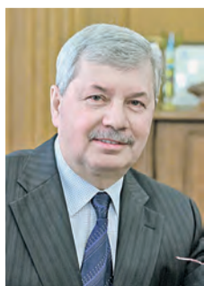
Владимир МЯКУШ, председатель Законодательного собрания Челябинской области