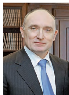
Борис ДУБРОВСКИЙ, губернатор Челябинской области

• ПОЗДРАВЛЯЕМ • ПОЗДРАВЛЯЕМ • ПОЗДРАВЛЯЕМ • ПОЗДРАВЛЯЕМ