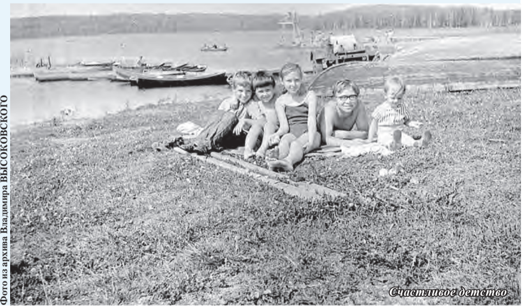
Фотосъемка архивная. Вспомогательный ВЫСОКОВОСКОГО