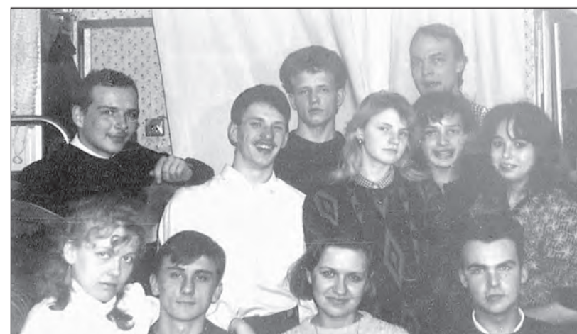
Группа сварщиков-первокурсников МТ-137, 1991 г.