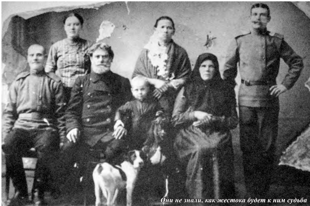
Они не знали, как жестока будет к ним судьба