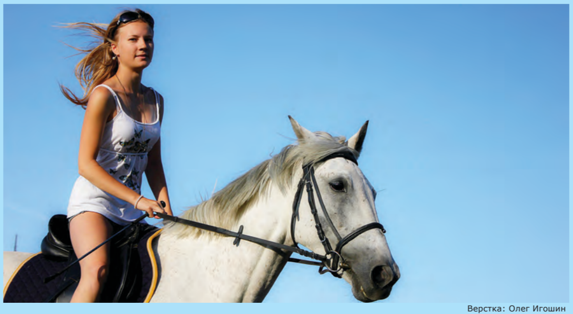
Верстка: Олег Игошин