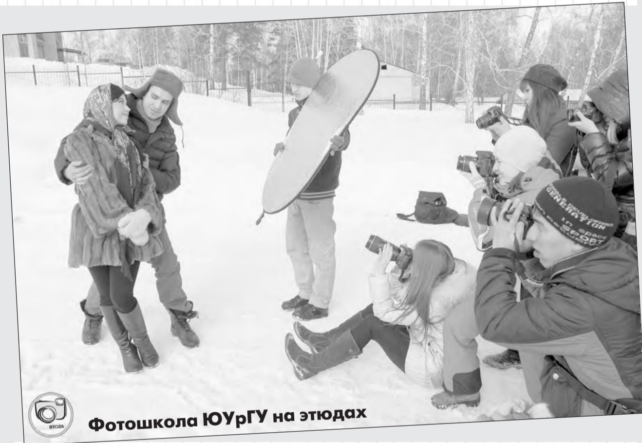
Фотошкола ЮУрГУ на этюдах