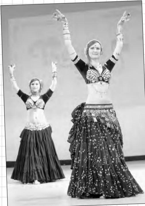
Фото Романова ВА. ЛИХАНОВА