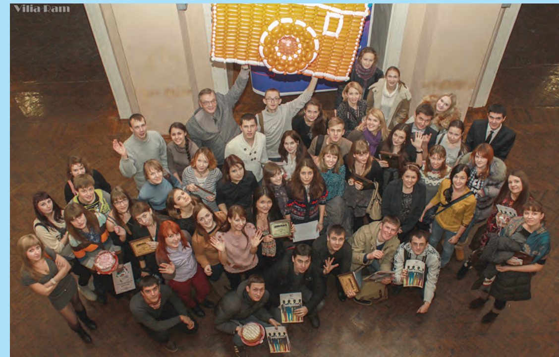
Верстка: Олег Игошин