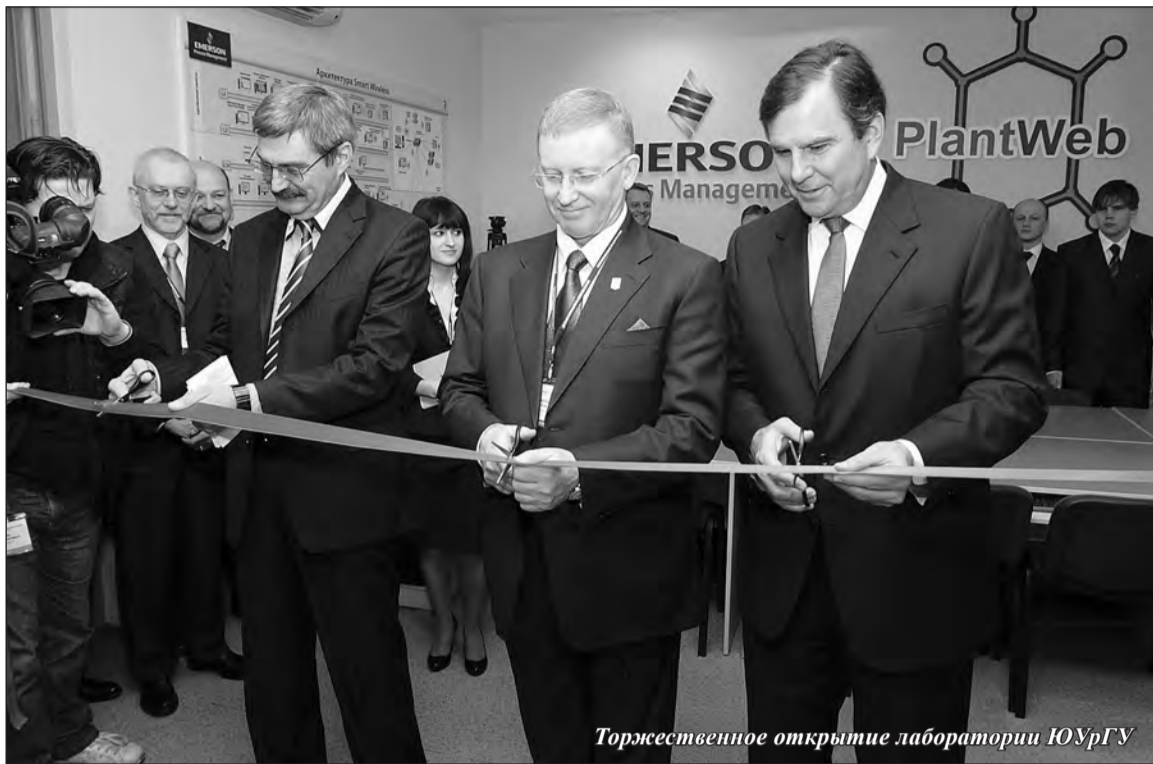
Торжественное открытие лаборатории ЮУрГУ

— Так получилось, что я прошла три этапа переименования нашего вуза: после школы поступала в