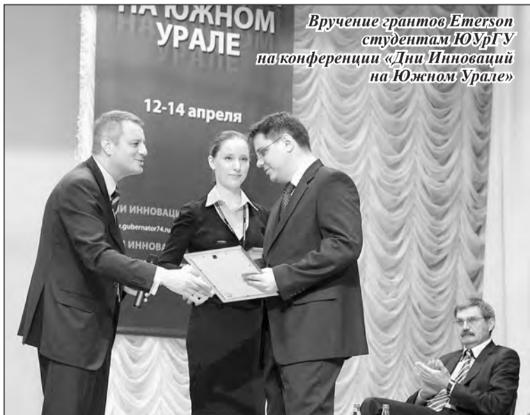
Вручение грантов Emerson студентам ЮУрГУ на конференции «Дни Инноваций на Южном Урале»

— Наше сотрудничество с ЮУрГУ началось в 2000 году с подготовки специалистов по заказу «Метрана». Со временем оно приобрело серьезные масштабы, и сегодня я оцениваю его как исключительно успешное.