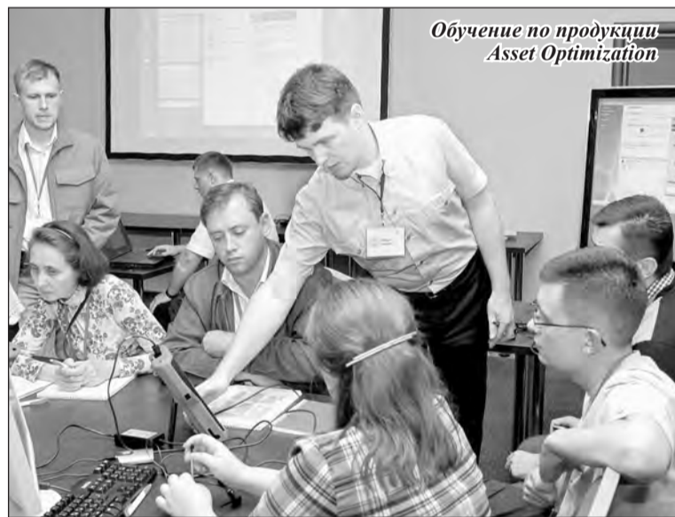
Обучение по продукции Asset Optimization

инициатив. Среди них важное место занимает университетская программа сотрудничества, в рамках которой ведутся совместные научно-исследовательские опытные конструкторские разработки (НИОКР). Наиболее активной компания сотрудничает с приборостроительным факультетом ЮУрГУ. Руководство предприятия поддерживает тесный контакт с кафедрой информационно-измерительной техники, заве-