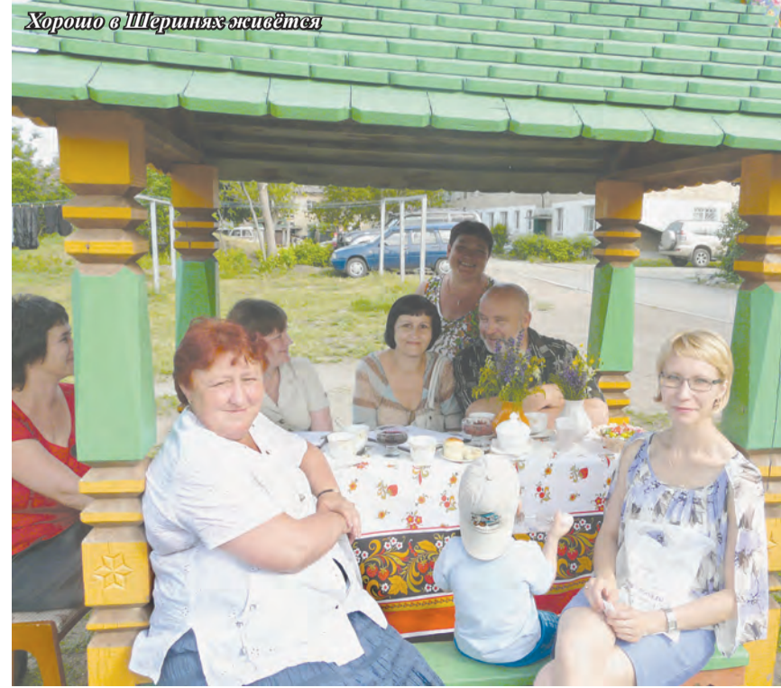
Хорошо в Шершневском живётся