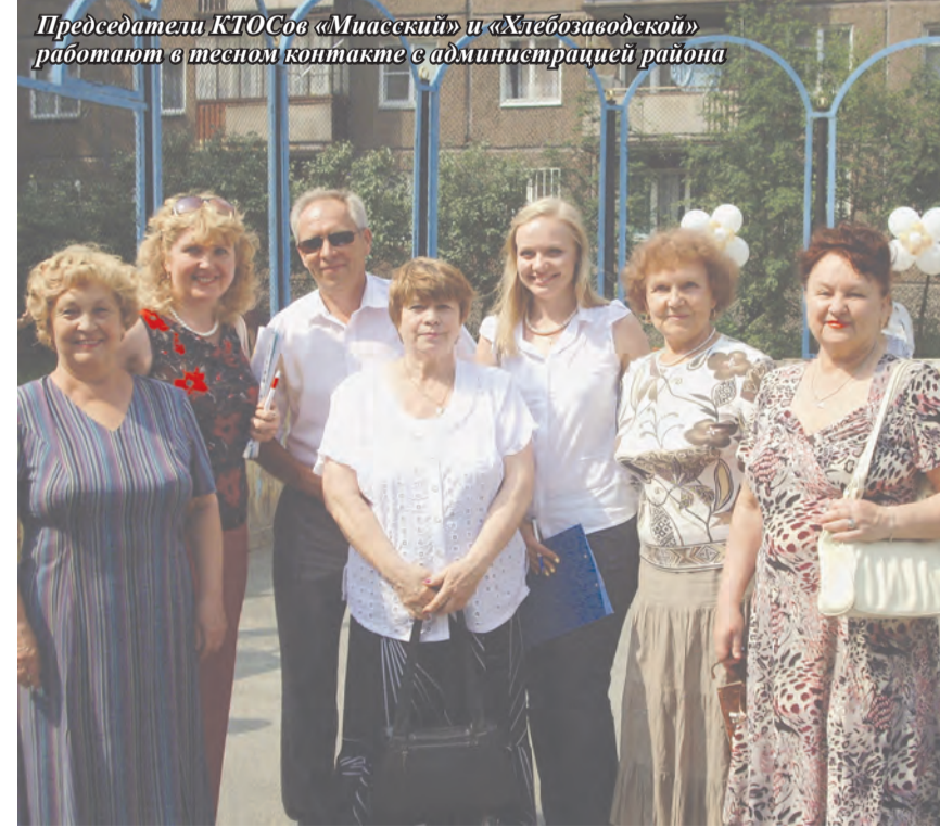
Председатели КТОСов «Миасский» и «Хлебозаводской» работают в тесном контакте с администрацией района