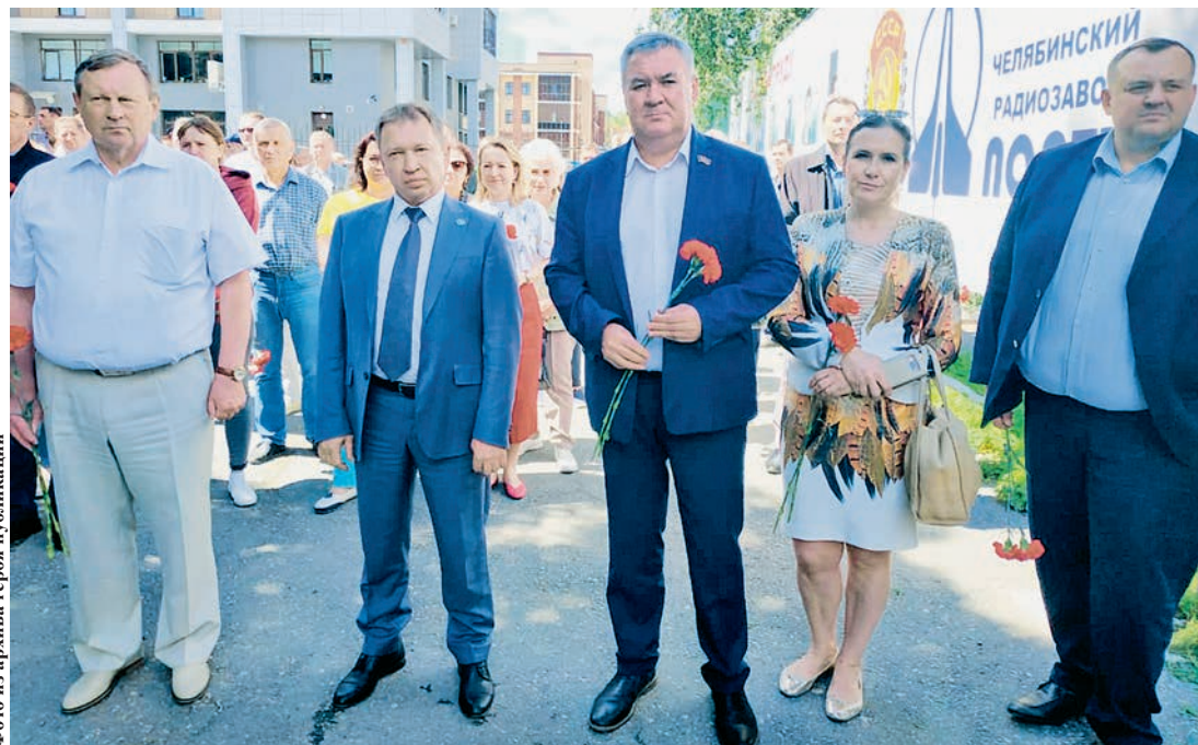
Фото из архива героя публикации