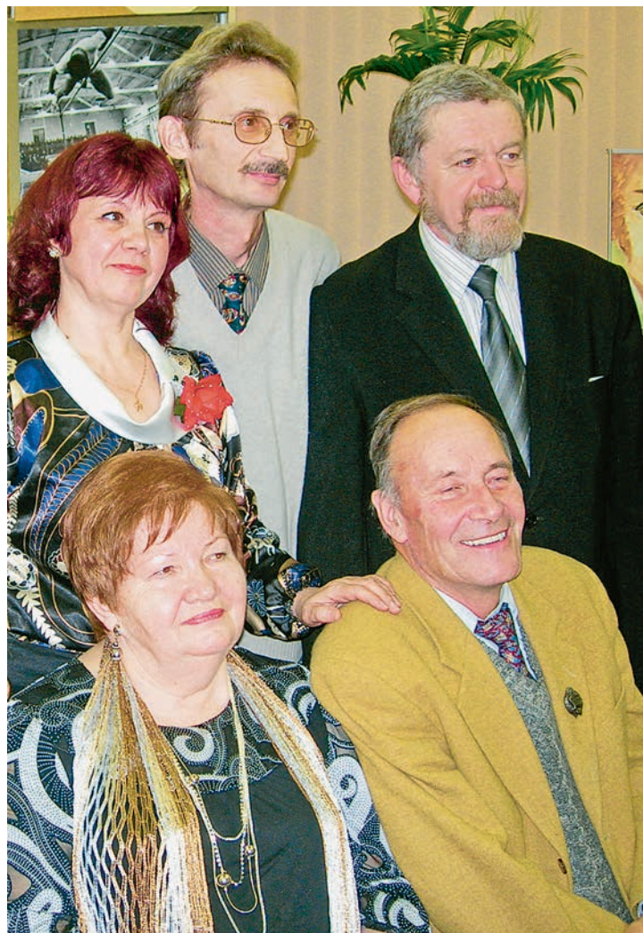
Бывшие студкору выросли в известных писателей