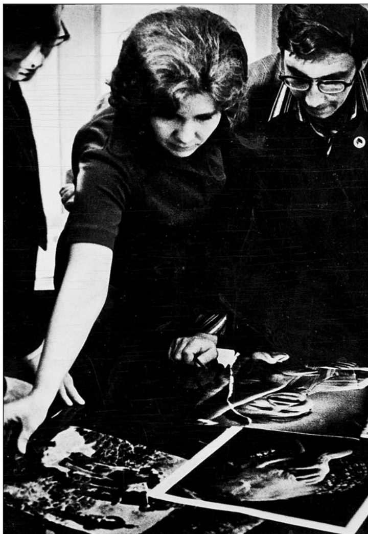
Выбор иллюстрации – дело ответственное!