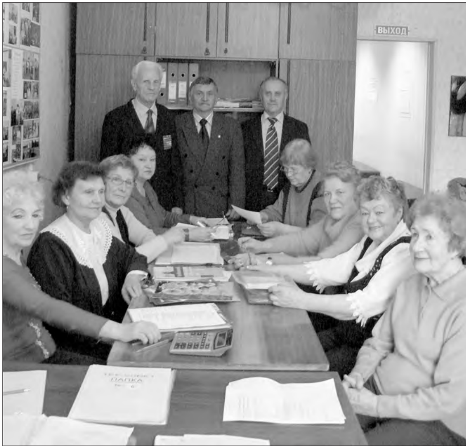
Три богатыря и восемь очаровательных женщин – дружная команда Совета ветеранов Центрального района готова праздновать юбилей!

Мы попросили виновников торжества рассказать, чем живет сегодня общественная организация ветеранов, поделиться успехами и трудностями, с которыми приходится сталкиваться в повседневной жизни.