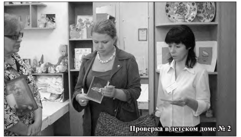
Проверка в детском доме № 2

Свои встречи члены клуба планируют сделать регулярными. Одна из них состоялась 24 августа в Законодательном Собрании Челябинской области. На встрече была документально закреплена структура клуба и определен график его работы.