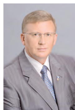
Александр Леонидович ШЕСТАКОВ, депутат Законодательного Собрания Челябинской области, ректор Южно-Уральского государственного университета;

Жители Центрального района всегда отличались социальной активностью: на его территории находится большое количество общественных организаций. Депутаты Законодательного Собрания области, Челябинской городской Думы со своей стороны прикладывают все усилия, чтобы город расцветал и преображался, развивалась инфраструктура, повышалось качество жизни челябинцев.